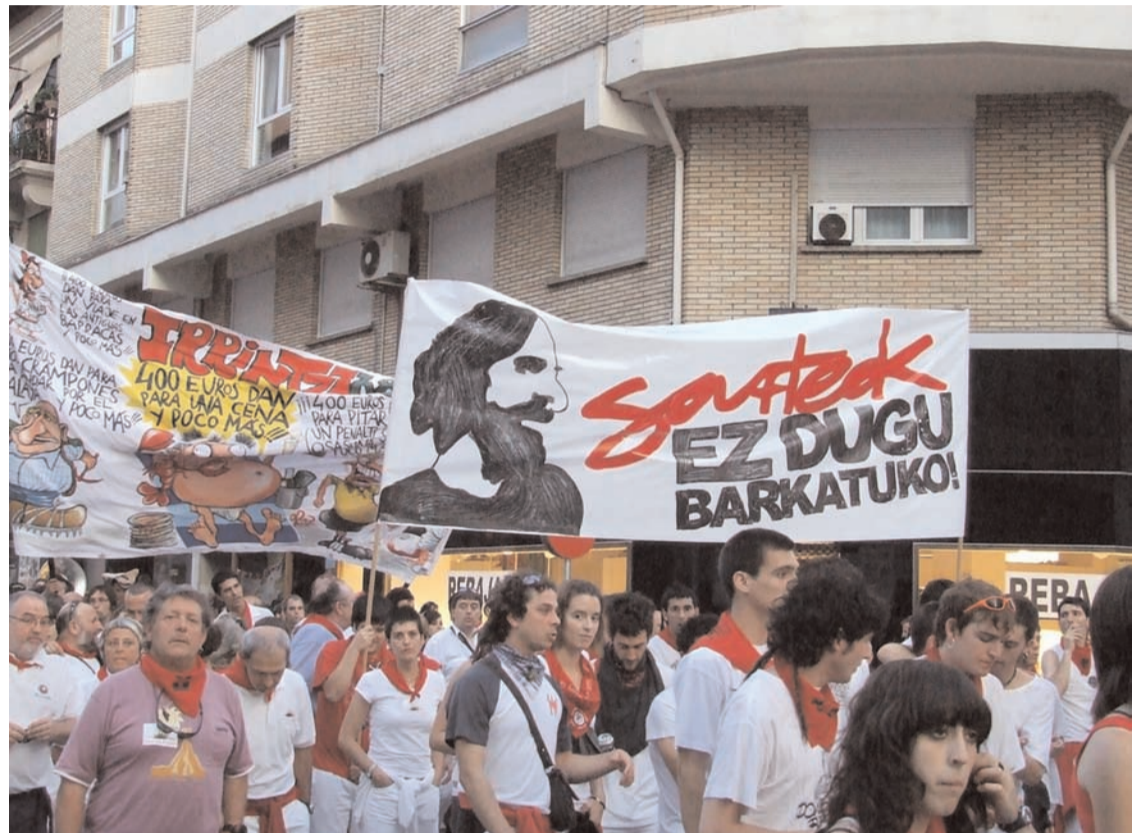
Por la mañana se realizó una ofrenda floral en el monolito y por la tarde una gran manifestación recorrió las calles centricas de Iruñea.