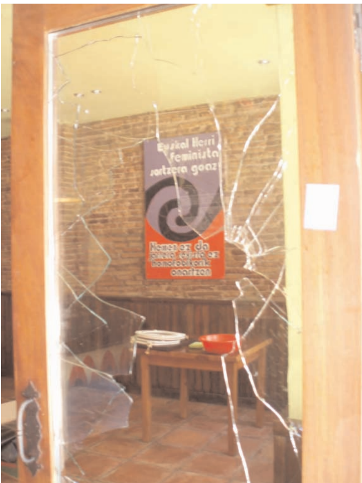
La puerta del bar Bodegika rota por los porrazos municipales. A la derecha una prueba de la labor de censura sin mucho criterio estético.

Por otro lado, un joven fue detenido en la madrugada del 15 en la calle Tejería. Según los testigos presenciales, la Policía Municipal le propinó una paliza, por lo que tuvo que ser trasladado al hospital. Al parecer, el motivo de la detención fue que portaba un carro con un equipo de música en funcionamiento.