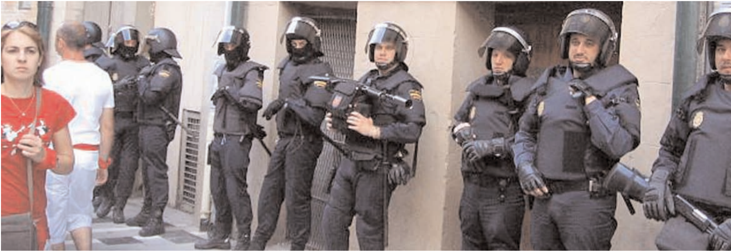
Unos 200 policías vigilaron las inmediaciones del txupinazo para evitar la entrada de la ikurriña.

Decenas de policías nacionales, forales, guardias civiles y municipales ocuparon las entradas de la Plaza del Ayuntamiento y alrededores para impedir la entrada de la ikurriña y otras reivindicaciones. No lo consiguieron, pero la imagen ahí quedó.